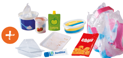
Pots, gourdes, tubes, sachets et films en plastique, barquettes en plastique et en polystyrène...