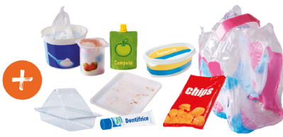
Pots, gourdes, tubes, sachets et films en plastique, barquettes en plastique et en polystyrène...