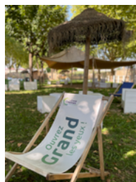
Espace détente Digoin